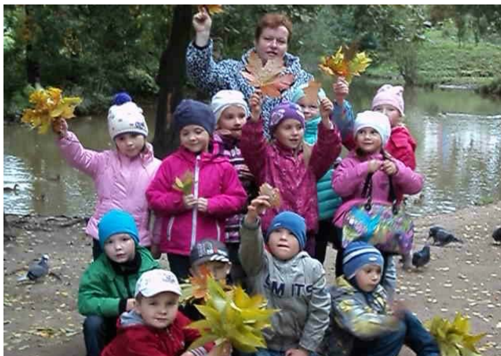
Парк им. С. Есенина